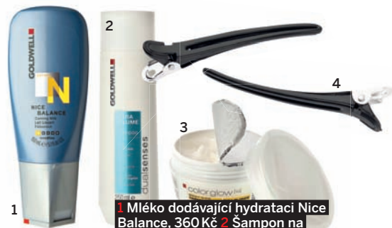
1 Mléko dodávající hydrataci Nice Balance, 360 Kč 2 Šampon na objem Ultra Volume, 420 Kč 3 Regenerační maska pro blondýny Color Glow Hairmasque, 490 Kč; vše Goldwell 4 Sponky pro separování vrstev vlasů při foukání, Kadeřnické studio Fellini, 30 Kč