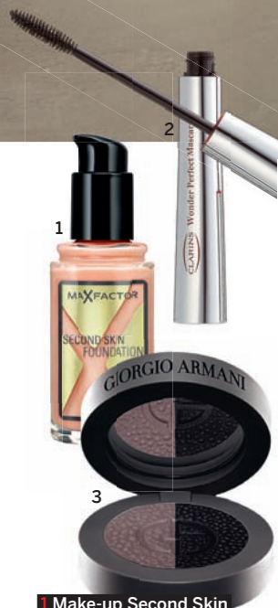
1 Make-up Second Skin Foundation, odstín 080, Max Factor, 429 Kč 2 Prodlužující řasenka Wonder Longueur, odstín 02, Clarins, 740 Kč 3 Duo očních stínů Manta Ray, odstín Charcoal, Giorgio Armani, 1150 Kč